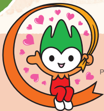
山口県 PR本部長 ちよるる

認知症の方やそのご家族、地域住民、医療・介護職員など、誰もが気軽に集い、情報交換や交流ができる憩いの場です。